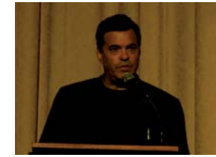
Amos Gitai en una anterior participación en Besalú.

La sexta edición del Festival de Cine Judío de Besalú (Girona) dedica