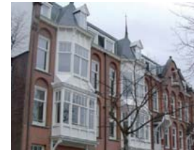
Edificio en el que vivió Etty Hillesum, en Amsterdam.

Sanz Briz, Perlasca, Felipe Propper y José Ruiz Santaella -quien fue Agregado en la Embajada de España en Berlín en 1944 y que logró ocultar y salvar a tres mujeres judías al dárles empleo como servicio doméstico en su casa de Diedersdorf-, han sido distinguidos por Israel con el título de 'Justo entre las Naciones'.