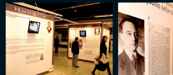
La muestra recoge en diversos paneles y montajes audiovisuales la heroica labor de algunos diplomáticos españoles para salvar a judíos de la amenaza nazi que azotaba Europa.